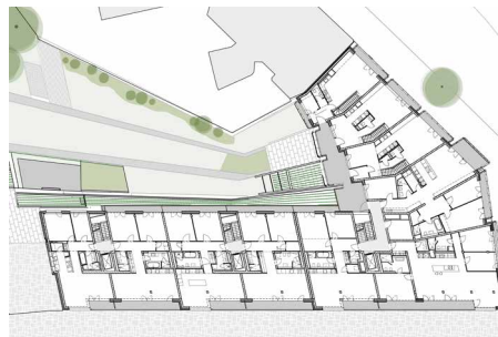
Grundriss 2. OG