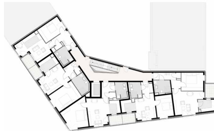
Grundriss 3. OG