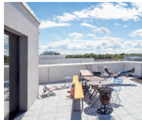
Gemeinsame Nutzung der Dachterrasse