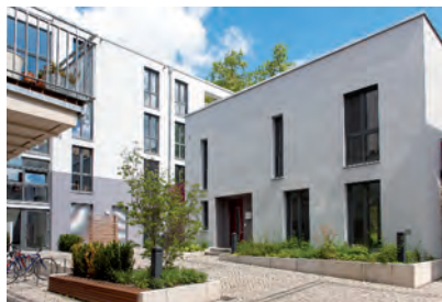
Modernes Wohnen in der historischen Altstadt