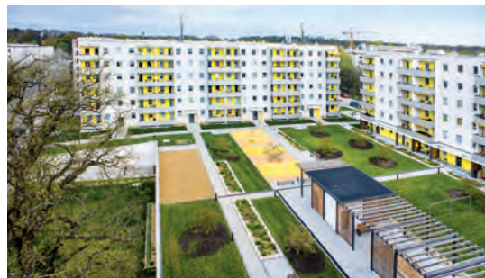
Völlig neue Qualitäten der Wohnumfelder