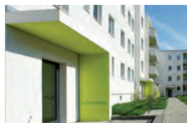
Eingänge mit Leitfarbe und Leitworten zeigen an, zu welchem Quartier das Gebäude gehört.