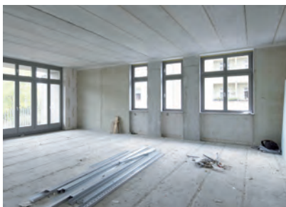
Übernahme Rohbau zum Selbstausbau