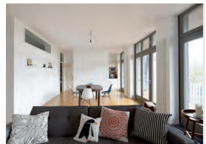
Ausbaupaket 'Standard Wohnung'