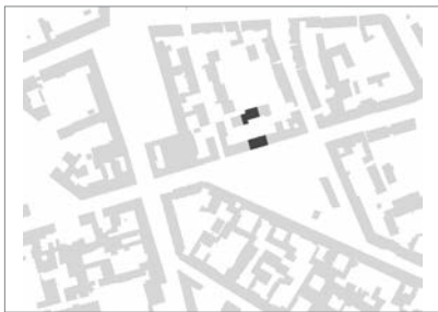
Klassische Lückenbebauung verbindet Privatheit mit urbaner Dichte und Vielfalt

sowie die im Ansatz kluge Wahl energiesparender Bauteile und Technologien für das Ensemble noch gesteigert wird. Ein Beitrag, welcher der Auslobung des Deutschen Bauherrenpreises in hohem Maße entspricht.