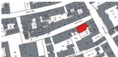
Lageplan in der Innenstadt