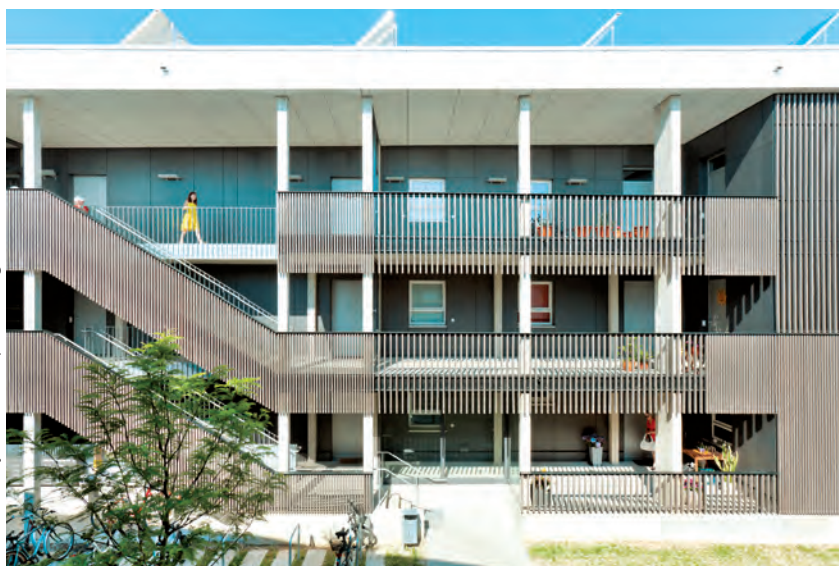
Geförderter energieeffizienter Wohnungsbau